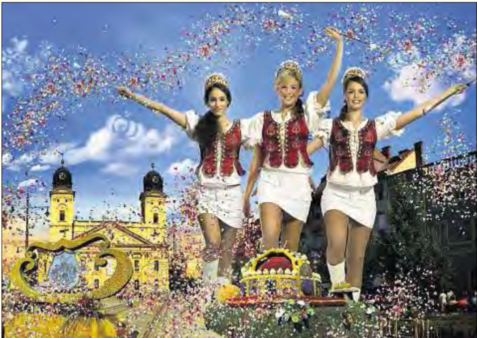
Blumenkarneval in Debrecen am 20. August 2009

Besuchen Sie unseren Ungarnstand - Stand E27 in der Halle 4 auf der Messe Dresdner Reisemarkt!