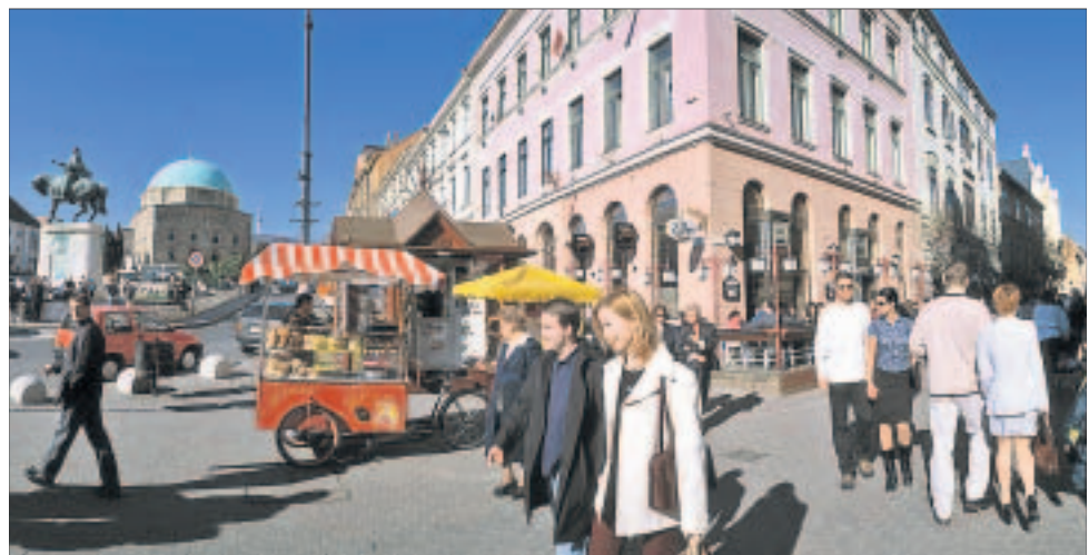
Eine alte Stadt mit jungem Publikum: Pécs im Südwesten Ungarns ist auch als Studienort beliebt. Im Hintergrund die grün gedeckte ehemalige Moschee.

Bereits zu bewundern ist das Besucherzentrum Cella Septichora mit den frühchristlichen Mausoleen im Nordosten der Innenstadt. „Die freigelegten Gebäude aus dem vierten Jahrhundert sind ein historisches Denkmal von besonderem Wert, denn sie bewahren die in der Antike seltene zweistöckige Form der Architektur von Sakralbauten“, erläutert Habel. „Sie dienen gleichzeitig als Grabkam-