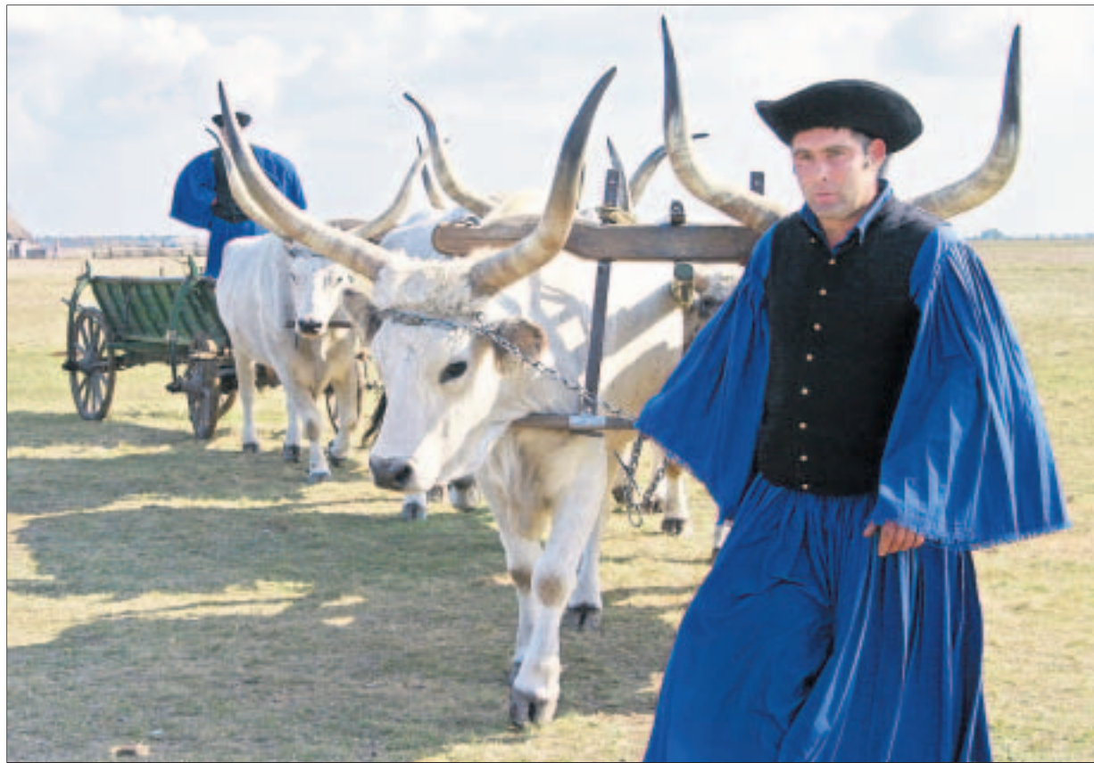
PUSZTA: Pferdehirten, Csikós genannt, veranstalten im Nationalpark Hortobágy im Osten Ungarns ein Spektakel, das an alte Zeiten erinnert. Hier hüten die Cowboys der Puszta Graurinder.