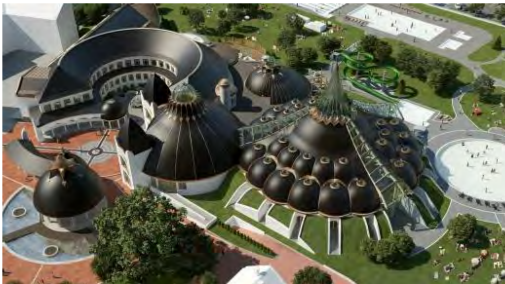
Übersicht über das neue Hagymatikum in Makó

Eröffnung am 20. Januar 2012 – Neuer Bäderkomplex mit außergewöhnlicher Architektur – Heilschlamm, Wellness und Erlebnisangebote