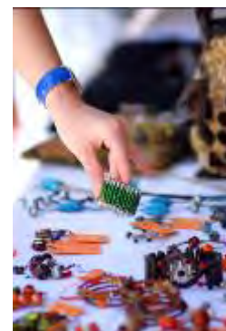
Schicke Unikate gibt's bei WAMP

Taschen aus Fahrradgummi, Schmuck und Wohndesign werden hier in ungewöhnlichen Formen und Farben präsentiert. Ein Geheimtipp ist ein Besuch im